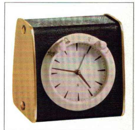
Abb. 1 (mit Weckeinrichtung)