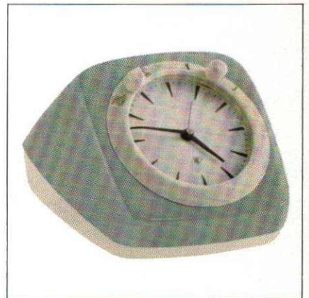
Abb. 2 (mit Weckeinrichtung)