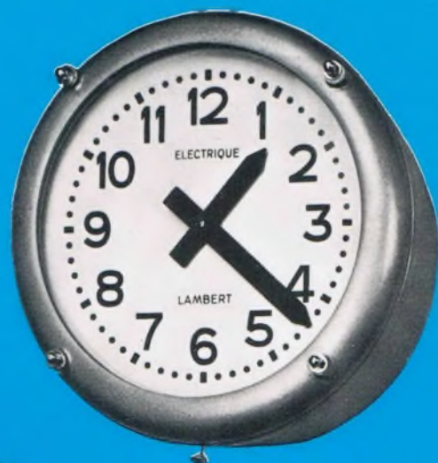
Type T. E. I.