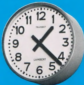
Type T. S.