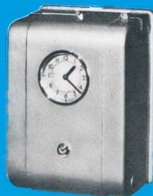
ENREGISTREUR à cartes cadastrées