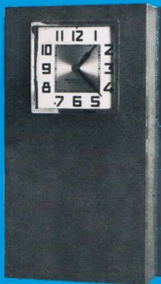
Type PM2 - PM3 - PM4 Pendules Mères