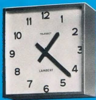
Type T. S. C.