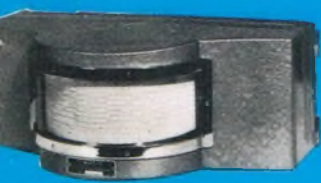
Type T 2 - T 3