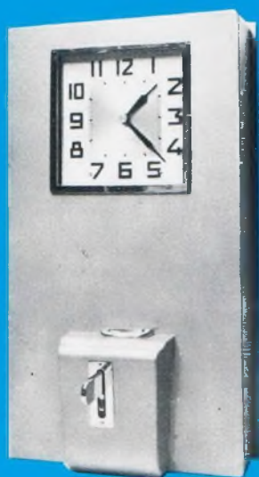
Type 481-481 bis-482 bis