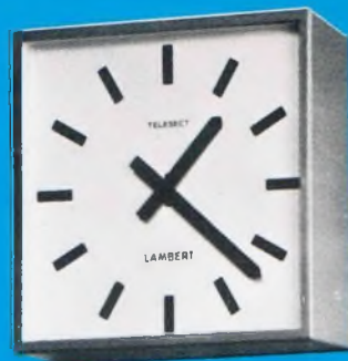
Type T. S. P.